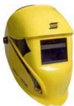
Origo™ Tech 9-13 žltá 0700 000 298 Origo™ Tech 9-13 čierna 0700 000 296