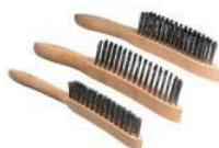
Kefa, 2 - radová 0760 024 100 Kefa, 3 - radová 0760 024 200 Kefa, 4 - radová 0760 024 300