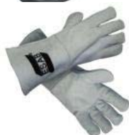
Heavy duty Basic 0700 005 007