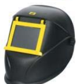
Eco-Arc 60x110, DIN 11 0700 000 938 Eco-Arc 90x110, DIN 11 0700 000 939